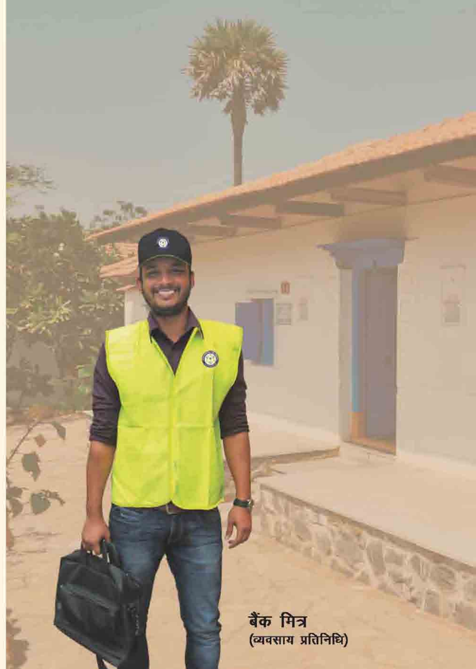
बैंक मित्र (व्यवसाय प्रतिनिधि)